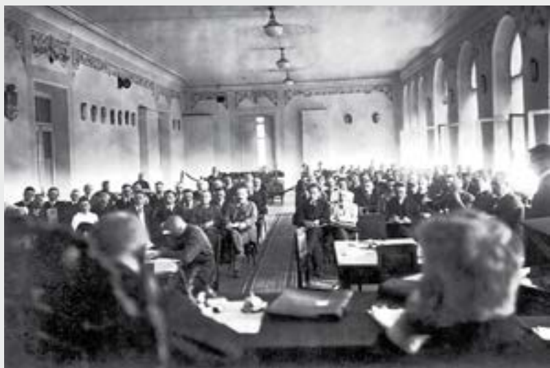
Steigiamojo Seimo posėdis. Kaunas, 1920 m. gegužės mėn. VDKM

Steigiamojo Seimo rinkimai buvo surengti 1920 m. balandžio 14–15 dienomis. Tai buvo pirmieji visuotiniai, lygūs, slapti ir tiesioginiai rinkimai Lietuvoje. Balsavimo teisę turėjo visi Lietuvos piliečiai, sulaukę 21 metų amžiaus. Rinkimų kampanija buvo įnirtinga, o rinkėjų aktyvumas nepaprastai didelis – rinkimuose dalyvavo net 90 proc. visų turėjusių teisę balsuoti piliečių (682 291 asmuo). Balsuojama buvo už sąrašus, kuriuos galėjo siūlyti partijos ir nepartinės grupės – iš