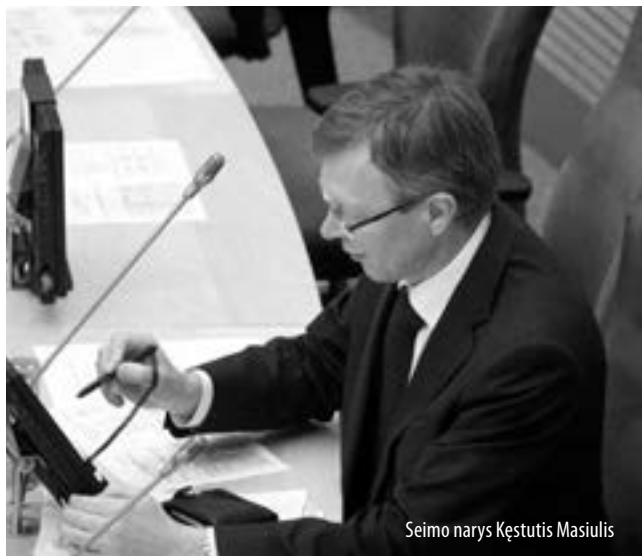
Seimo narys Kęstutis Masiulis

Seimo specialiosios tyrimo komisijos pirmininkas K. Masiulis taip pat pateikė Seimo nutarimo „Dėl pritarimo Seimo specialiosios tyrimo komisijos dėl Seimo narių pateiktų siūlymų pradėti apkaltos procesą Seimo nariui Linui Karaliui pagrįstumui ištirti ir išvadai dėl pagrindo pradėti apkaltos procesą parengti išvados“