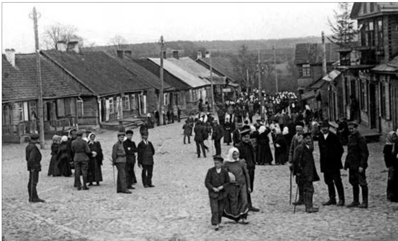
Rinkimai į Steigiamąjį Seimą Alytuje 1920 m. balandžio 15 d. LNM

Per daugiau kaip dvejus metus trukusį darbą Steigiamasis Seimas priėmė apie 300 įstatymų, turėjusių lemiamos reikšmės šalies kultūriniam, visuomeniniam,