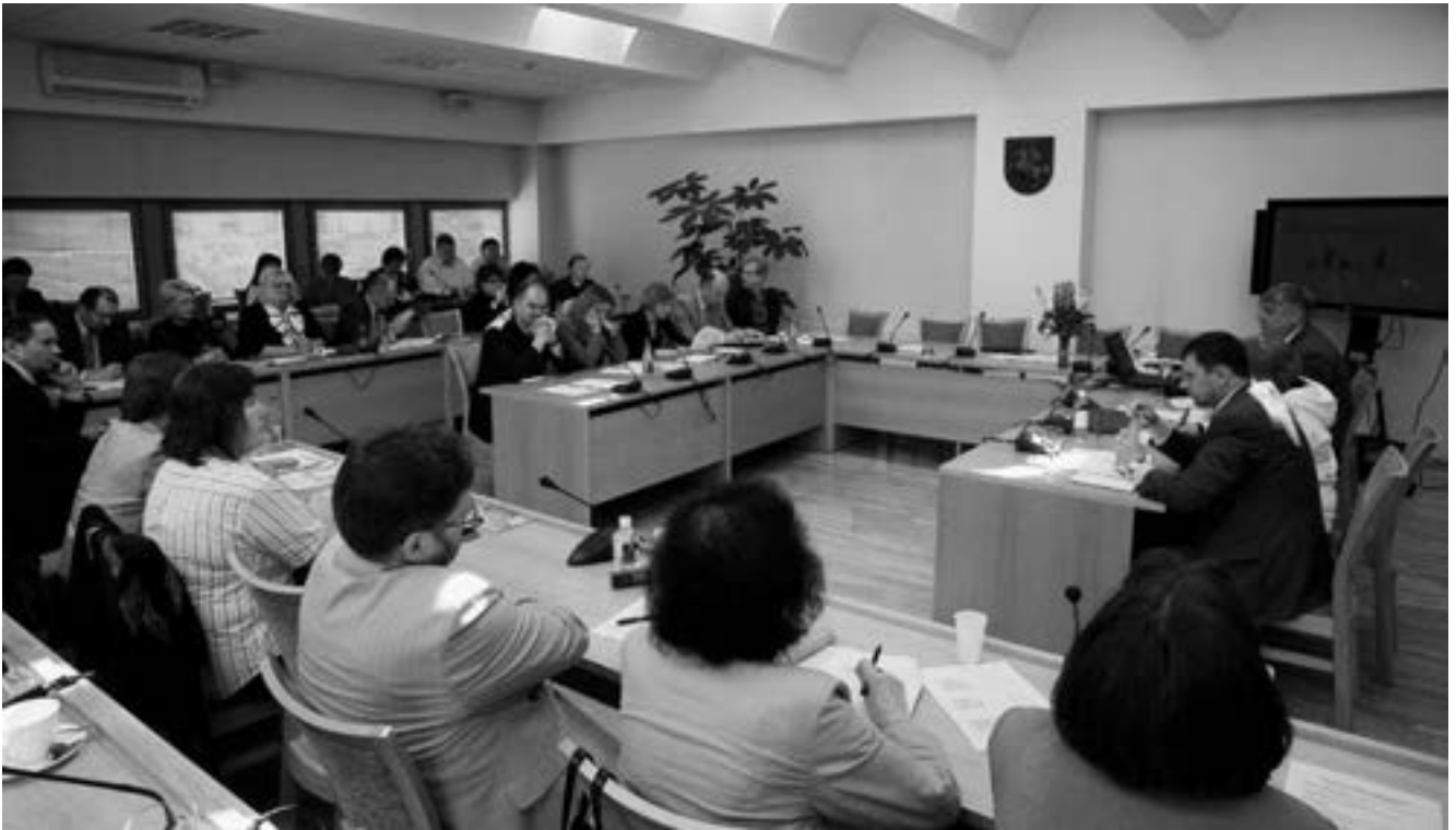
Posėdžiauja Švietimo, mokslo ir kultūros komitetas

konkuravimas vienoje grupėje vieniems stojantiems suteikdavo didesnę prioritetą nei kitiems, todėl meno studijų srities studijų krepšeliai buvo suskirstyti į dvi studijų krypčių grupes: architektūros, dailės, dizaino, fotografijos ir medių krypčių, muzikos, teatro ir kino, šokio krypčių. Komiteto nariai dėl studentų priėmimo į menų studijas tvarkos pasikeitė nuomonėmis su posėdyje dalyvavusiais Lietuvos muzikos ir teatro akademijos, Vilniaus dailės akademijos atstovais.