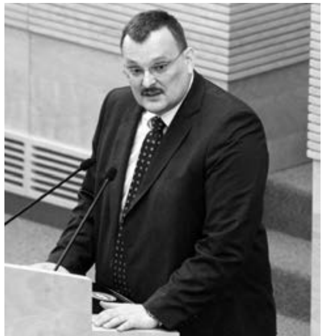
Seimo narys Kęstutis Daukšys

– Genetiškai modifikuotų organizmų įstatymo 2 ir 10 straipsnių pakeitimo ir papildymo įstatymo projektą Nr. XIP-2064, kuris numato mokestininės rinkliavos įvedimą už kiekvieną šalyje pagamintą, importuotą ir tiekiamą rinkai genetiškai modifikuotų veislių sėklų, produktų, vaistų, medicininių gaminių ar pašarų pakuotę. Priėmus šį projektą, fiziniai ir juridiniai asmenys privalėtų į valstybinį Privalomojo sveikatos draudimo fondą mokėti 5 proc. dydžio įmokas nuo pagaminto, importuoto ir tiekiamo rinkai viso produkto vertės. Pritarus projektui po pateikimo, pradėta jo svarstymo procedūra. Balsavo: už – 78, prieš – 1, susilaikė 21. Pagrindiniu komitetu projektui svarstyti paskirtas Ekonomikos komitetas, papildomais – Aplinkos apsaugos, Kaimo reikalų, Sveikatos reikalų bei Teisės ir teisėtvarkos komitetai.