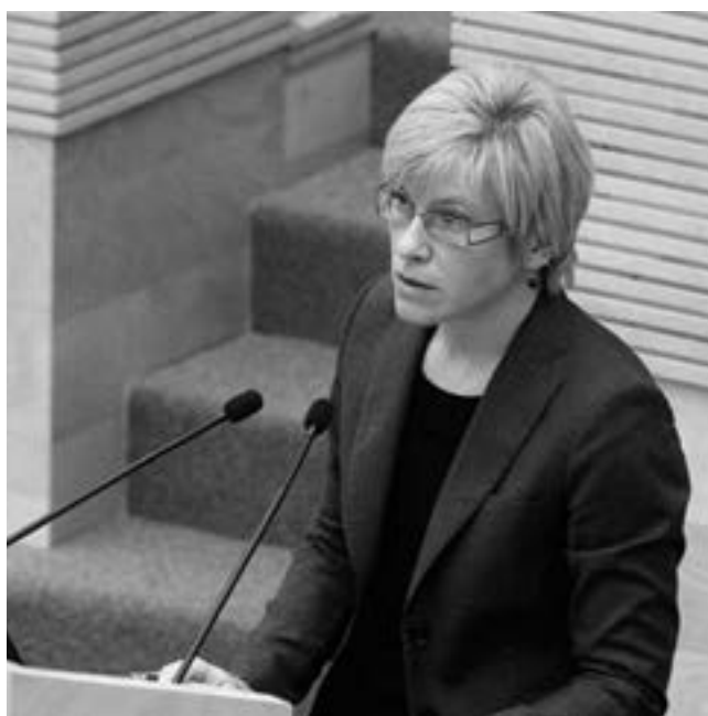
Finansų ministrė Ingrida Šimonytė