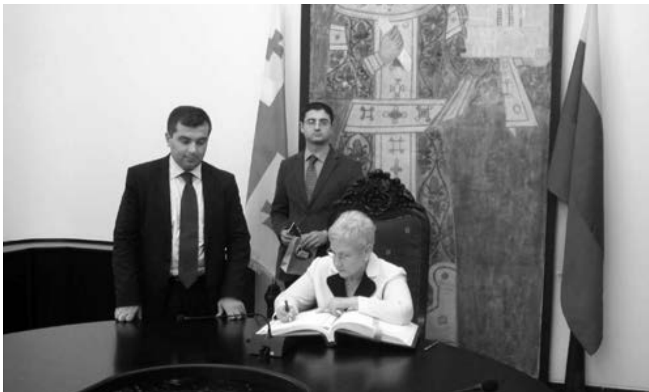
Seimo Pirmininkė Irena Degutienė pasirašė svečių knygoje

I. Degutienės nuomone, šiuo metu yra būtina stiprinti Lietuvos ir Gruzijos verslo ryšius, o Gruzijai daugiau dėmesio skirti laisvos prekybos sutartims su Europos Sąjunga pasiekti. „Šie darbai labai prisidėtų prie Gruzijos ryšių su likusiu demokratiniu pasauliu sustiprinimo, prie Gruzijos modernizacijos ir reikalingų reformų“, – sakė Seimo Pirmininkė.