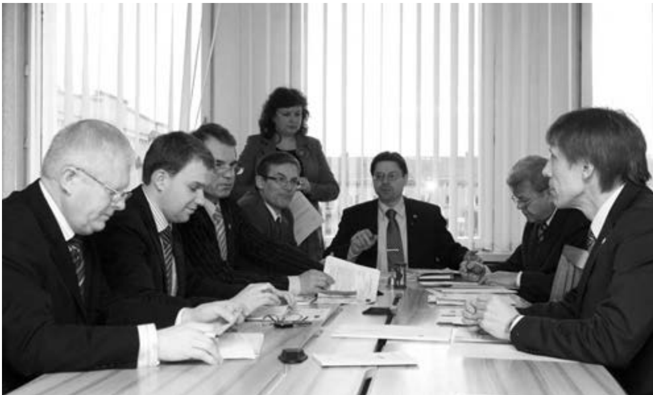
Teisės ir teisėtvarkos komiteto posėdyje

Komitetas, atsižvelgdamas į tai, kad, vadovaujantis Lietuvos Respublikos Konstitucijos 106 straipsnio 4 dalimi, Seimo nutarimas ištirti, ar aktas atitinka Konstituciją, sustabdo šio akto galiojimą, o 2010 metų valstybės biudžeto ir savivaldybių biudžetų finansinių rodiklių patvirtinimo įstatymas yra priimtas atsižvelgiant į įstatymus, dėl kurių atitikties Konstitucijai ir siūloma Seimo nutarimu kreiptis į Konstitucinį Teismą, nutarė atmesti Seimo nutarimo projektą Nr. XIP-1873.